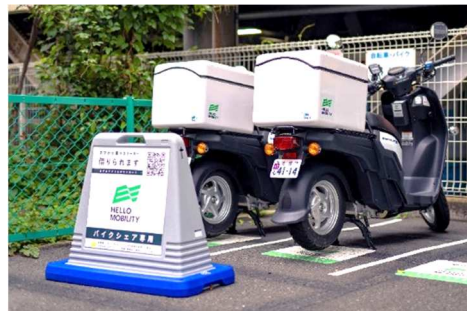
シェアリング電動バイク拠点